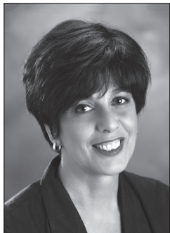
Monsieur Jacques Chagnon Président de l'Assemblée nationale Hôtel du Parlement Québec